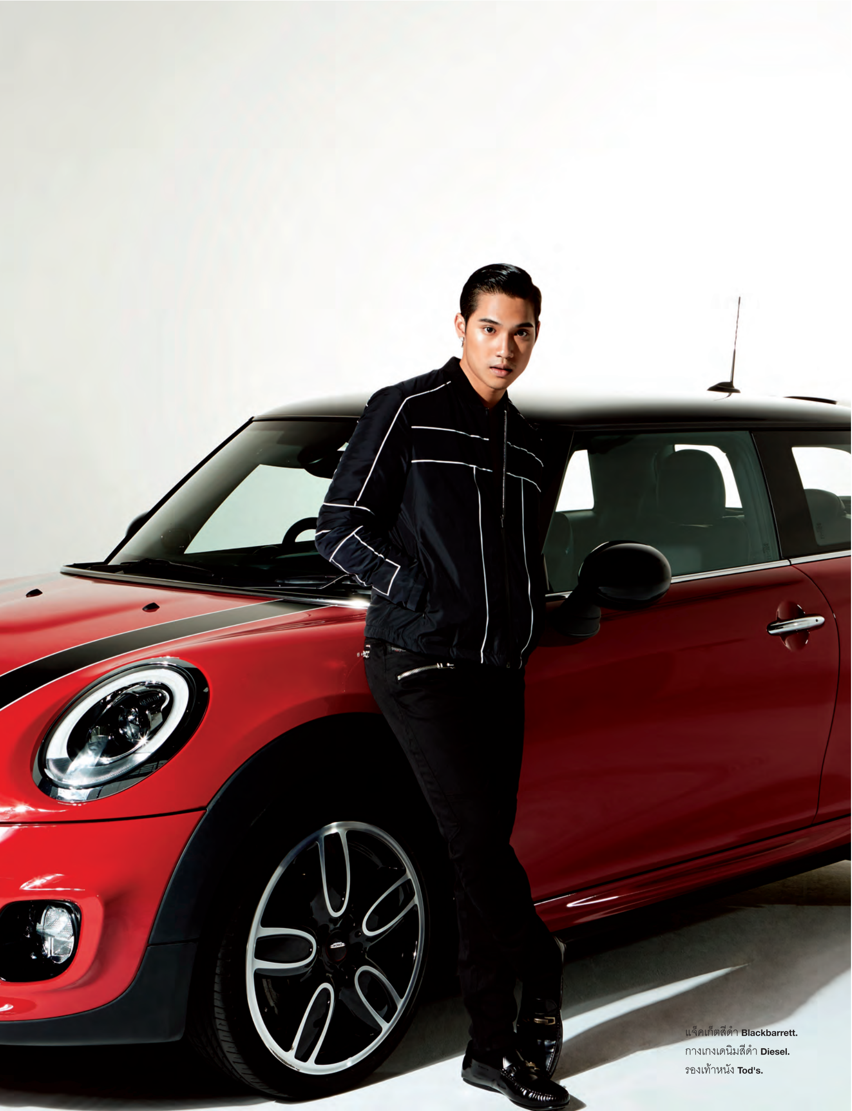
แจ็คเก็ตสีดำ Blackbarrett. กางเกงเดนิมสีดำ Diesel. รองเท้าหนัง Tod's.