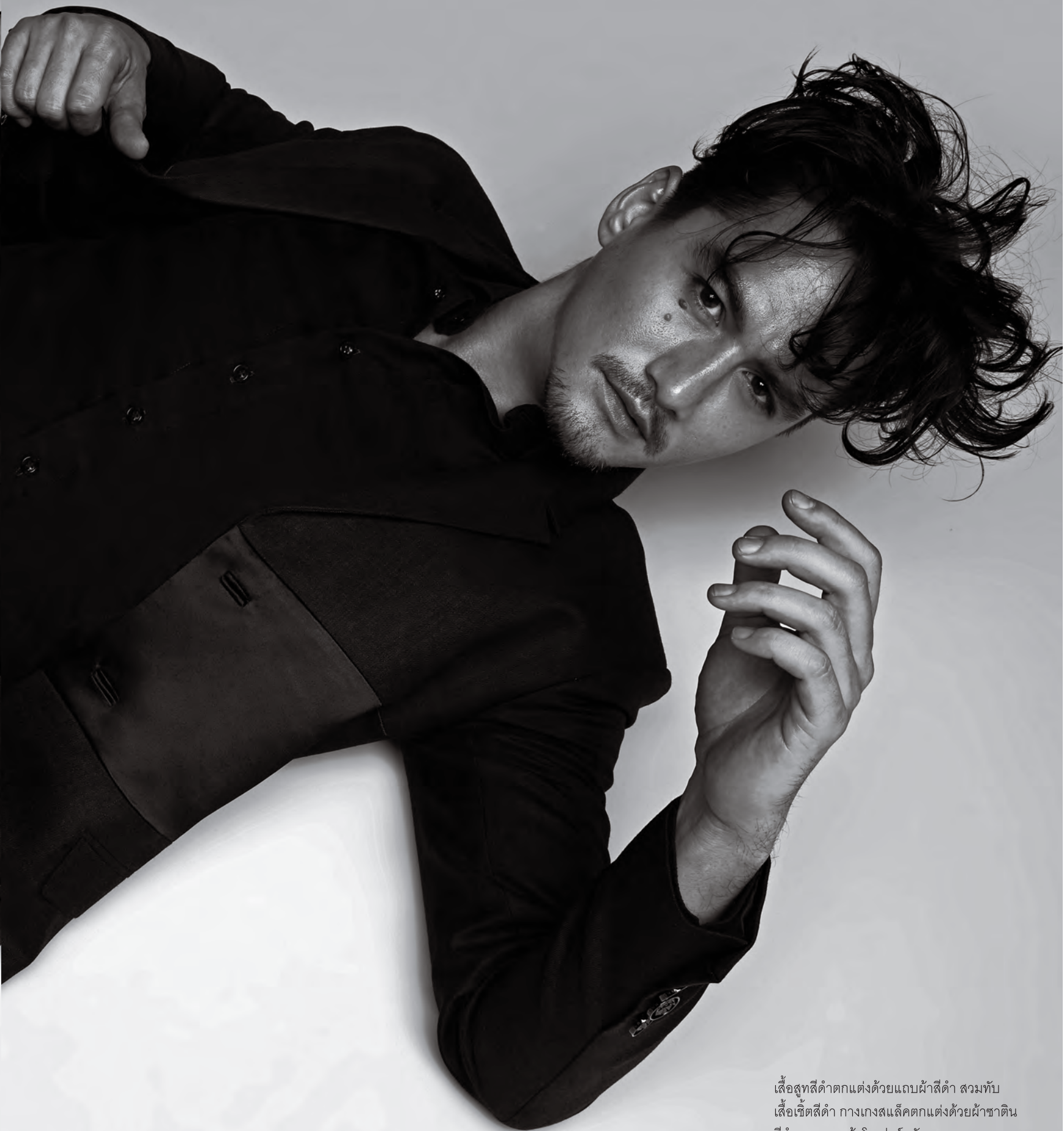
เสื้อสูทสีดำตกแต่งด้วยแถบผ้าสีดำ สวมทับ เสื้อเชิ้ตสีดำ กางเกงสแล็คตกแต่งด้วยผ้าซาติน สีดำ และรองเท้าโลเฟอร์หนัง Monlada.