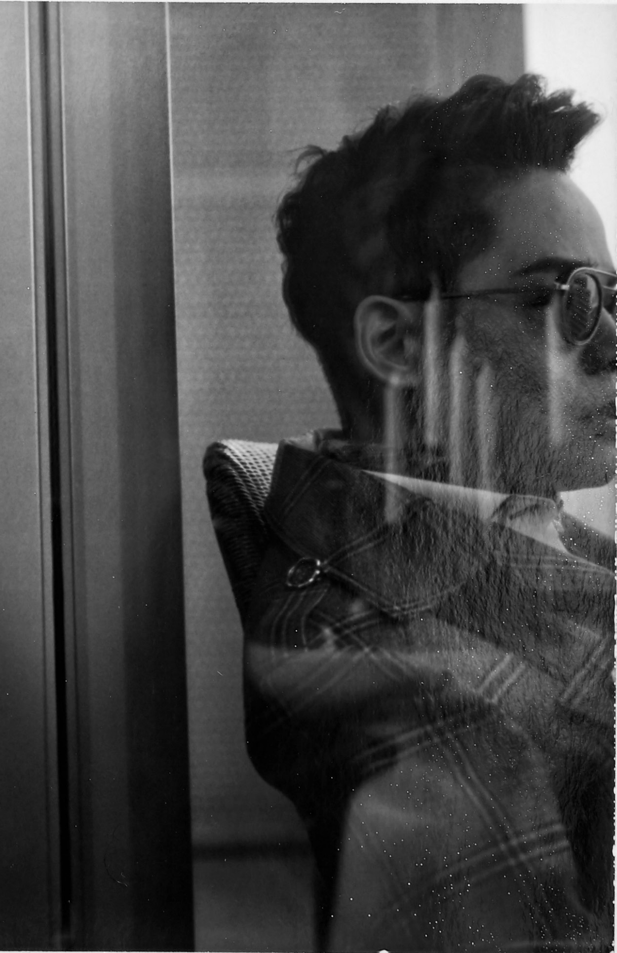
เสื้อโค้ทสีเทาตกแต่งกระดุมสีทอง เสื้อเชิ้ตสีขาวขลิบดำที่ขอบ S'Homme.