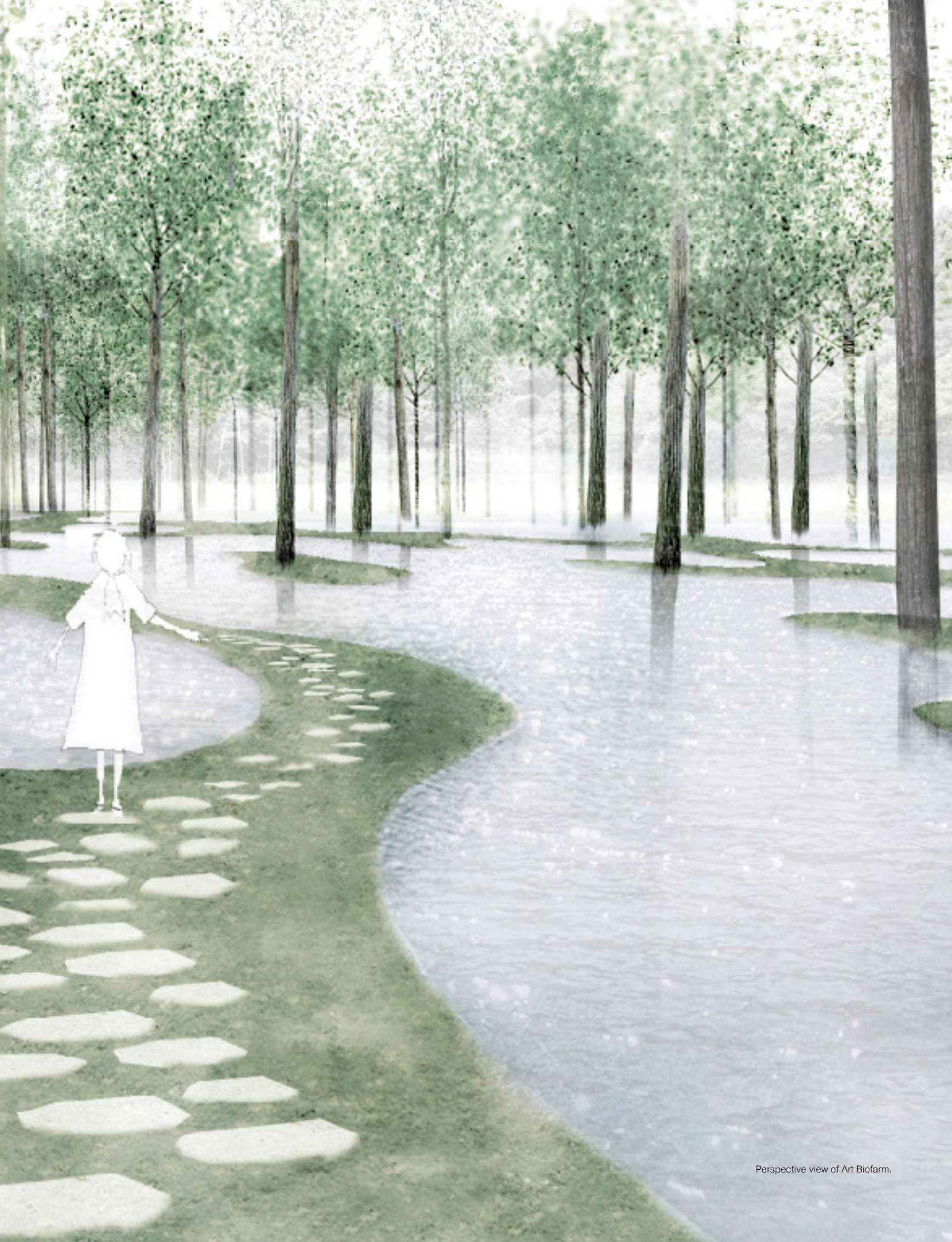
Perspective view of Art Biofarm.