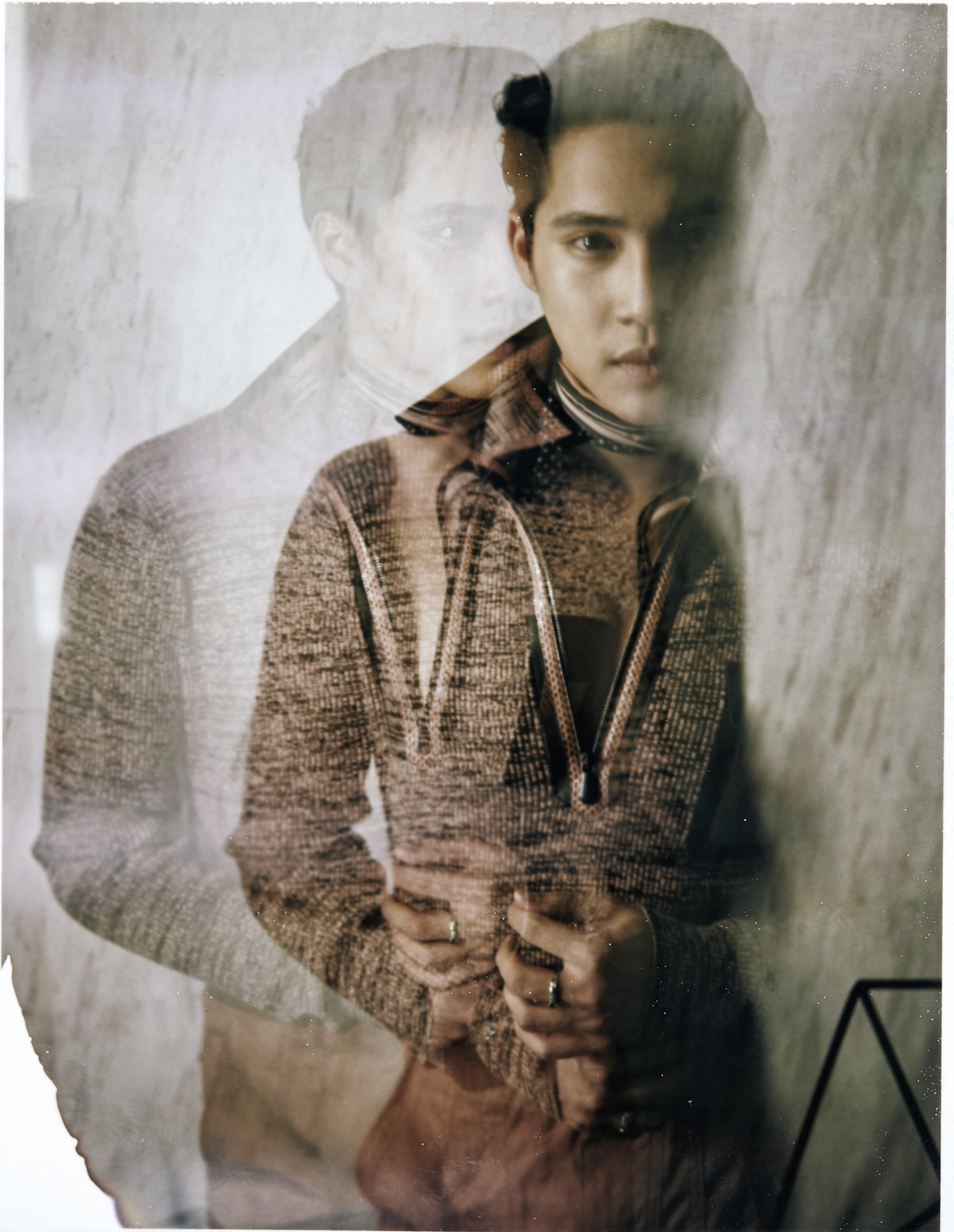
เสื้อเสวิตเตอร์สไตล์สปอร์ต กางเกง เข็มขัดหนัง Bottega Veneta.