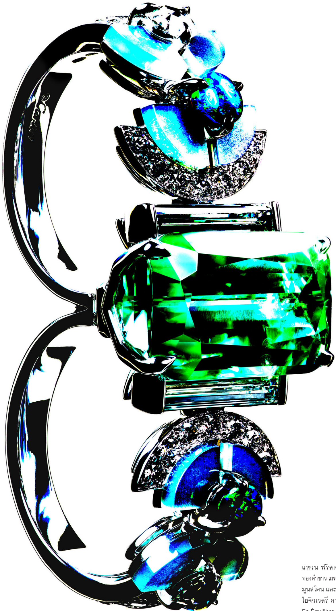
แหวน ฟริสตา "Frysta" ทำจาก ทองคำขาว แพลทินัม ทวีร์มาลีน โอปอล มูนสโตน และเพชร จากคอลเลกชั่น ไฮจิเวลรี่ คาร์ทีเยร์ ออง เอคิลิบร์ En Équilibre, CARTIER.