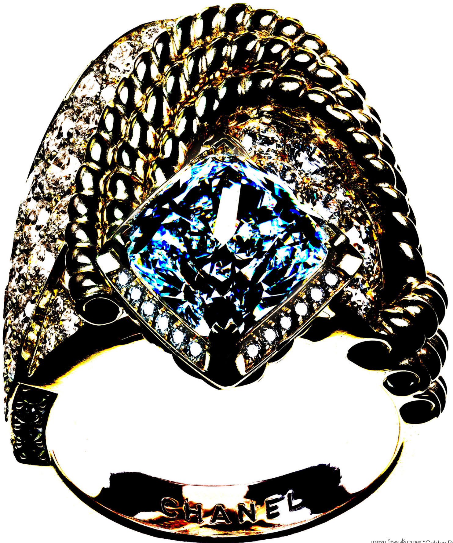
แหวน โกลด์นั้บรอด "Golden Braid" ทำจากทองคำและเพชร จากคอลเลกชัน ฟลายอิงคลาวด์ Flying Cloud, ชาเนล ไฮจิเวลรี่ CHANEL HAUTE JOAILLERIE.