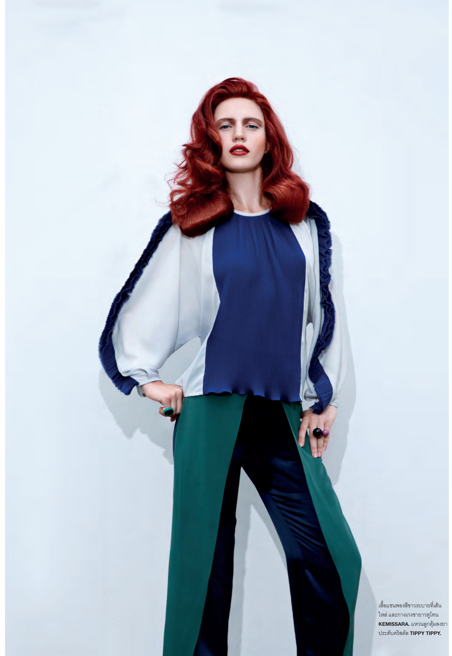
เสื้อแขนทูนอกสีขาวระบายที่เส้นไหล่ และกางเกงขายาวทูโทน KEMISSARA. แหวนลูกตุ้มลงยาประดับคริสตัล TIPPY TIPPY.