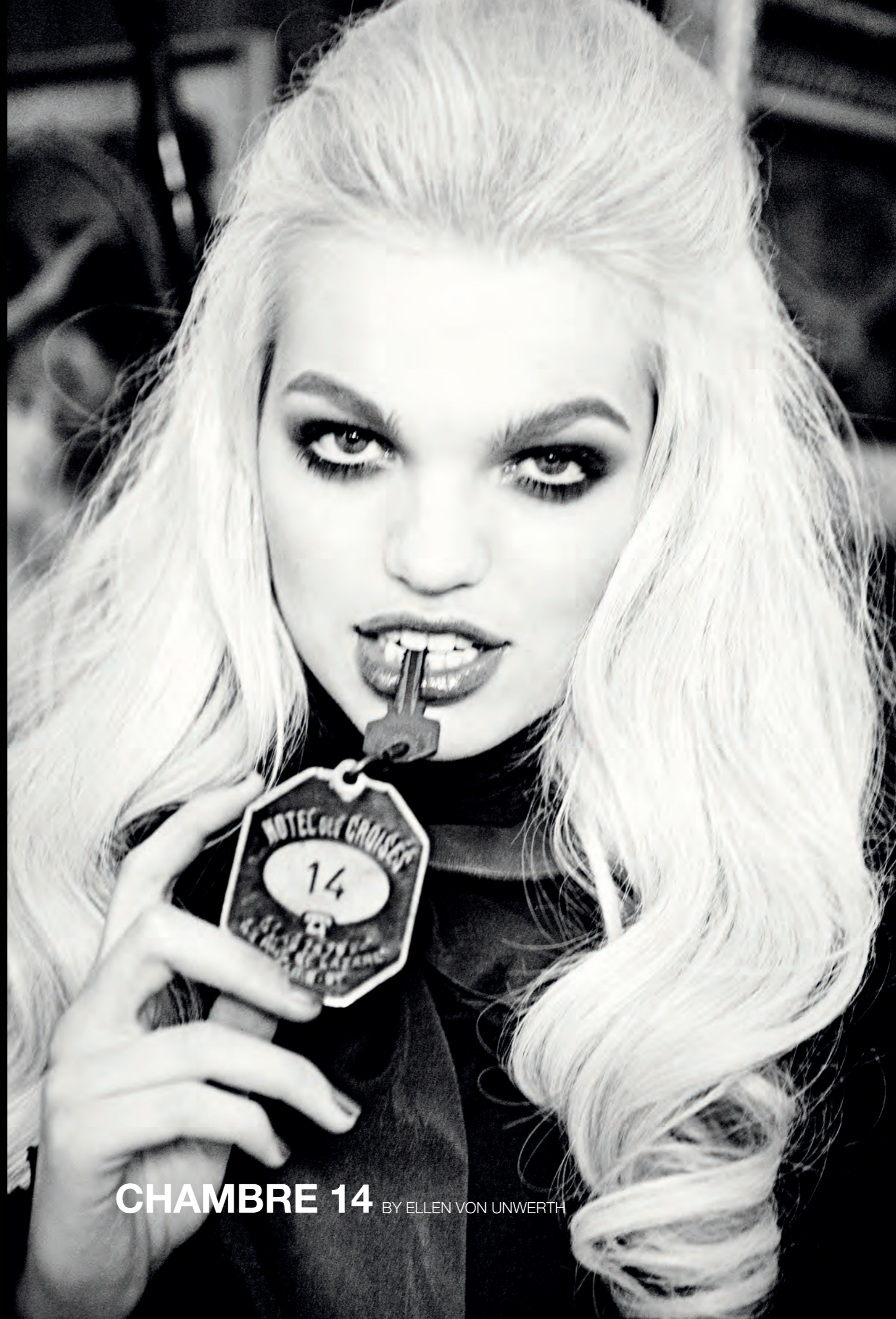
CHAMBRE 14 BY ELLEN VON UNWERTH