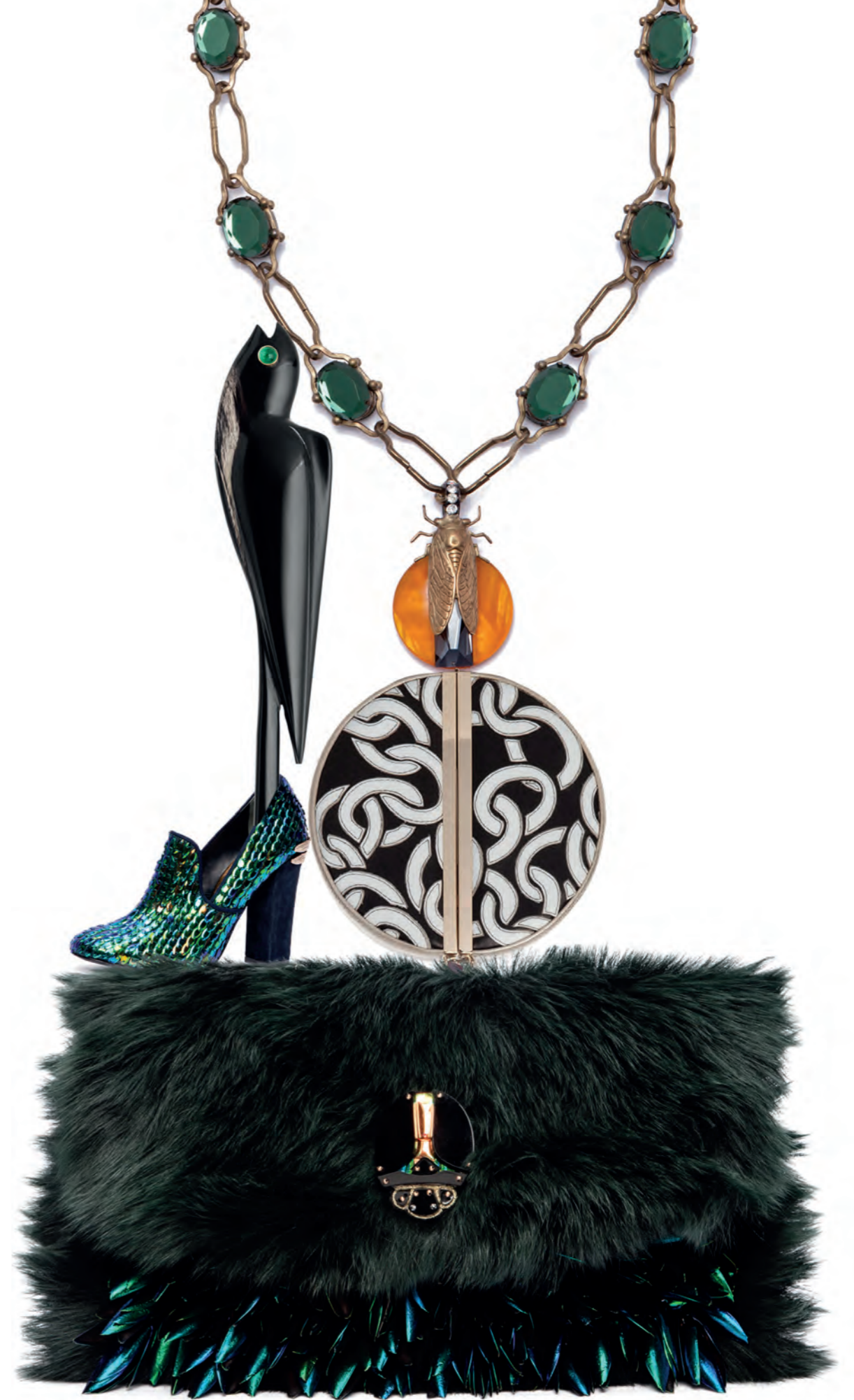
จากซ้ายไปขวาและจากบนลงล่าง เข็มกลัดนกสีดำ Louis Vuitton . สร้อยคอโซ่ทองประดับพลอยสีเขียวห้อยจี้รูปแมลง Tory Burch . รองเท้าประดับเลื่อมสีเหลือง Tory Burch . กระเป๋าคลัทช์ทรงกลมตกแต่งลาย Dvf Diane Von Furstenberg . กระเป๋าคลัทช์ขนสีเขียวประดับด้วยปีกแมลง Tory Burch .