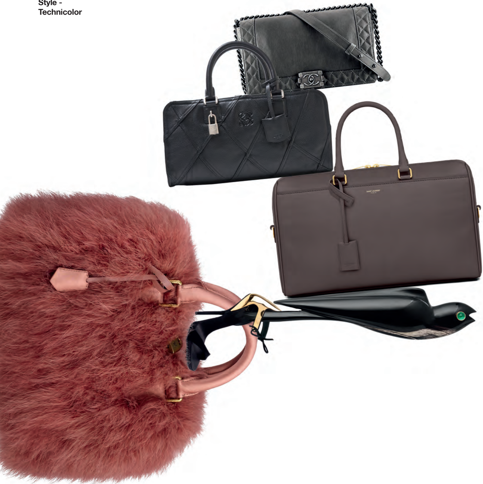
จากซ้ายไปขวาและจากบนลงล่าง กระเป๋า Speedy ขนมีงศ์สีชมพูหิวผ้าซาติน Louis Vuitton . รองเท้าส้นสูงรัดข้อสีดำตกแต่งโลหะสีทอง Giuseppe Zanotti @Shoecity . กระเป๋า Boy Chanel หนังสีเทาเข้ม Chanel . กระเป๋า Amazona เดินเส้นหนังเป็นลายจากคอลเล็กชั่น Junya Watanabe Comme des Garçons Collaboration Loewe . กระเป๋า Duffie หนังสีเทา Saint Laurent . เข็มกลัดนกสีดำ Louis Vuitton .