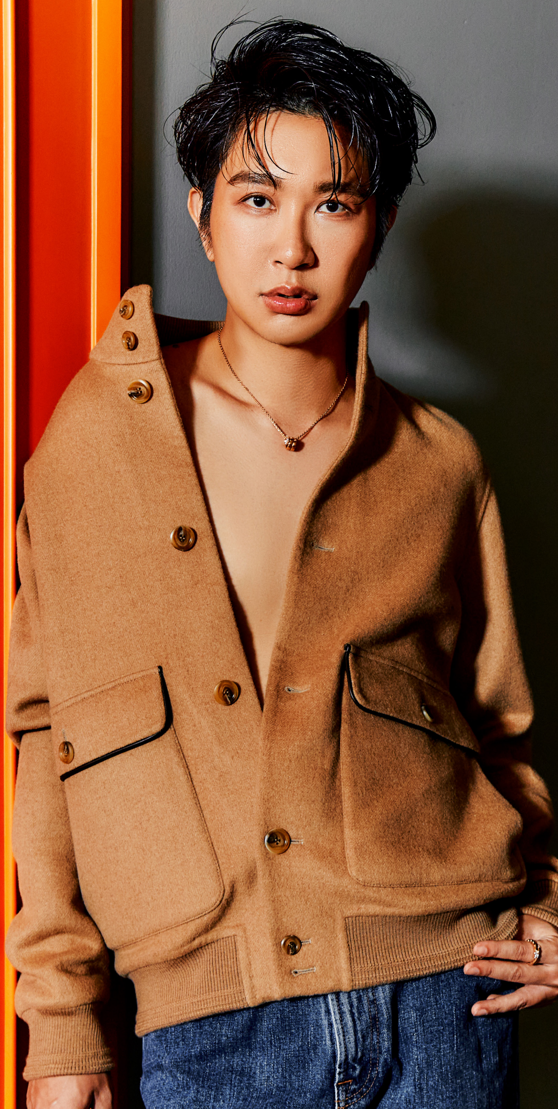
Bomber Jacket สีเบจ. 5 Pocket Jeans สีฟ้า. จาก Tod's สร้อยคอพร้อมจี้ประดับเพชร Serpenti Viper Necklace สีฟิงก์โกลด์. แหวนประดับเพชร Serpenti Viper Ring สีฟิงก์โกลด์. จาก Bvlgari