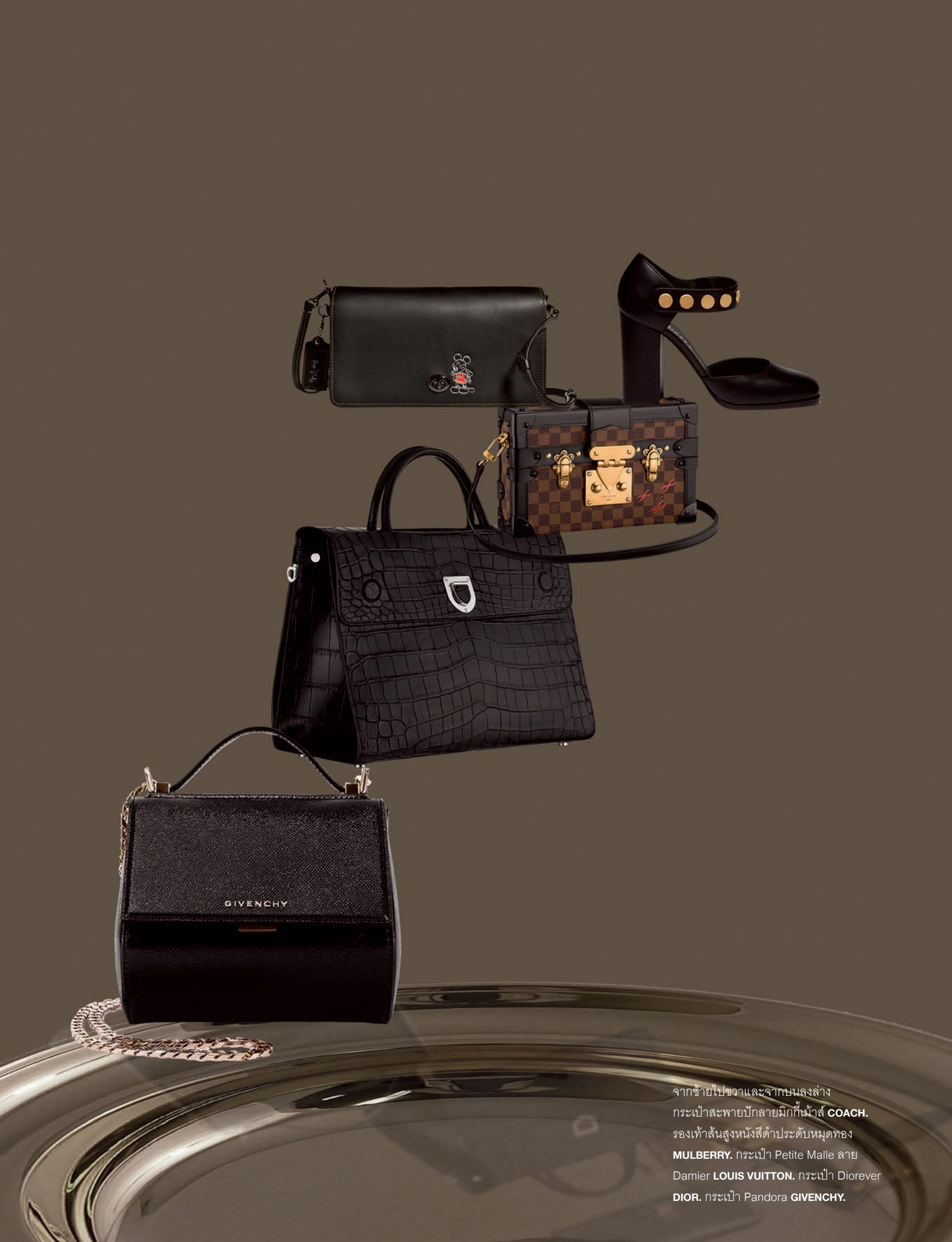
จากซ้ายไปขวาและจากบนลงล่าง กระเป๋าสะพายปีกลายมิกกี้เมาส์ COACH . รองเท้าส้นสูงหนังสีดำประดับหมุดทอง MULBERRY . กระเป๋า Petite Malle ลาย Damier LOUIS VUITTON . กระเป๋า Diorever DIOR . กระเป๋า Pandora GIVENCHY .