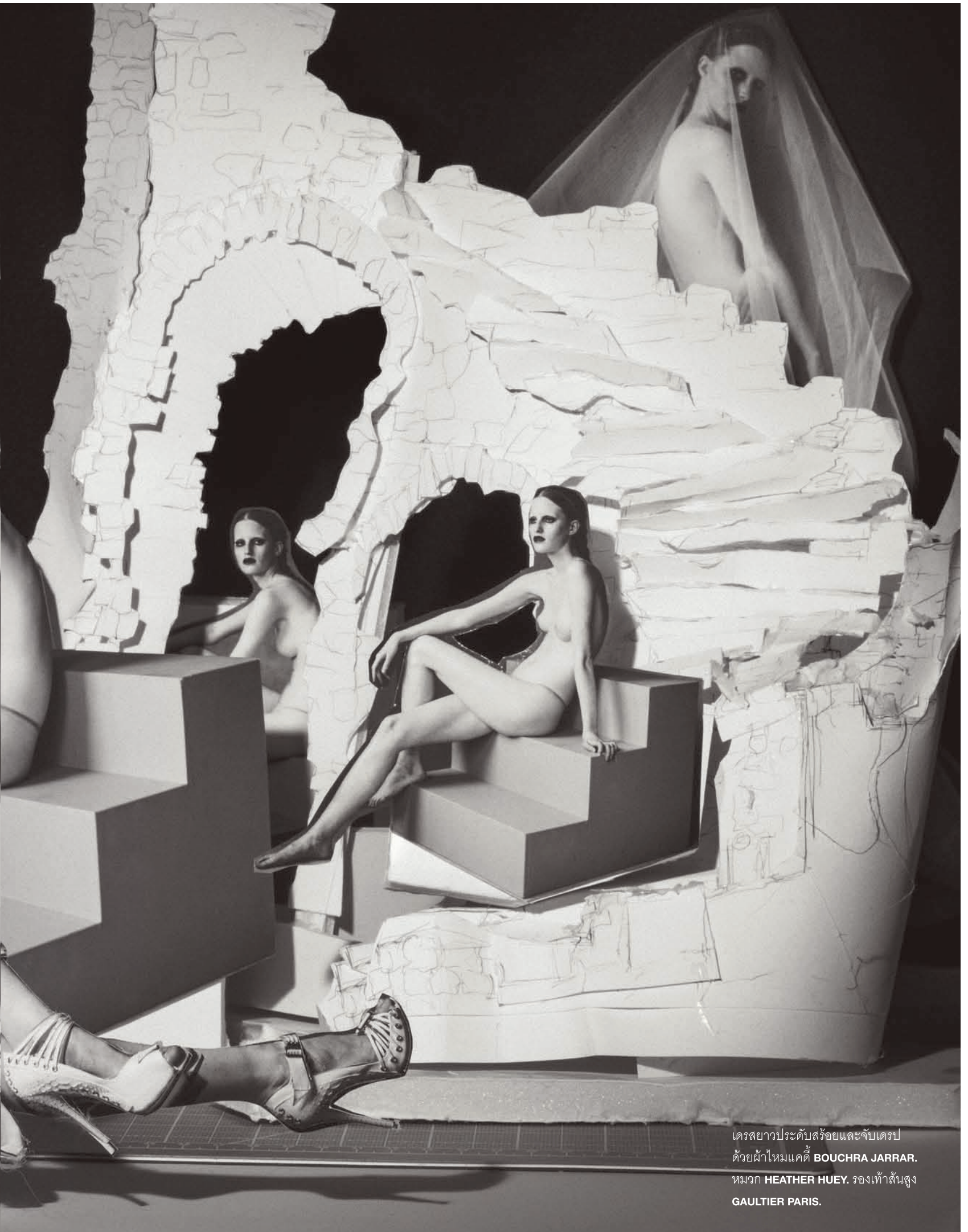
เดรสยาวประดับสร้อยและจับเดรส ด้วยผ้าไหมแคดี BOUCHRA JARRAR. หมวก HEATHER HUEY. รองเท้าส้นสูง GAULTIER PARIS.