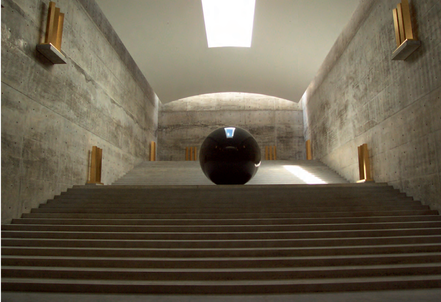
Walter De Maria "Time/Timeless/No Time", 2004.

หน้าเข้าสู่เกาะนาโอชิม่า (Naoshima) ทำเรือ Marine Station ที่ออกแบบโดย SANAA ต้อนรับผู้มาเยือนด้วยเสาสูงเรียวที่ดูสง่างามและหลังคาแบนราบ สโตนมิเนมอลที่มีความหนาเพียงน้อยนิด รอบๆ สถานี ผลงาน "Red Pumpkin" ของยาโยอิ คูซาม่า (Yayoi Kusama) และ "Naoshima Pavilion" โครงสร้างรูปทรงจีโอมेटริกที่ถูกออกแบบโดยสถาปนิกโซว ฟุจิโมโต (Sou Fujimoto) ตั้งอยู่อย่างโดดเด่นและทรงพลัง ภาพที่เห็นอยู่นี้เป็นต้นกำเนิดของปรากฏการณ์อันน่าทึ่งที่เกิดขึ้นจากการพบปะกันของศิลปะและสถาปัตยกรรม ซึ่งได้มอบจิตวิญญาณให้กับเกาะนาโอชิม่า (Naoshima) เตชิม่า (Teshima) และอินูจิม่า (Inujima) สามเกาะในตอนใต้ของประเทศญี่ปุ่นที่ล้วนแต่มีเอกลักษณ์ในตัวเอง ที่รวมตัวกันเป็นอาณาจักรศิลปะอันเปี่ยมไปด้วยความมีชีวิตชีวา