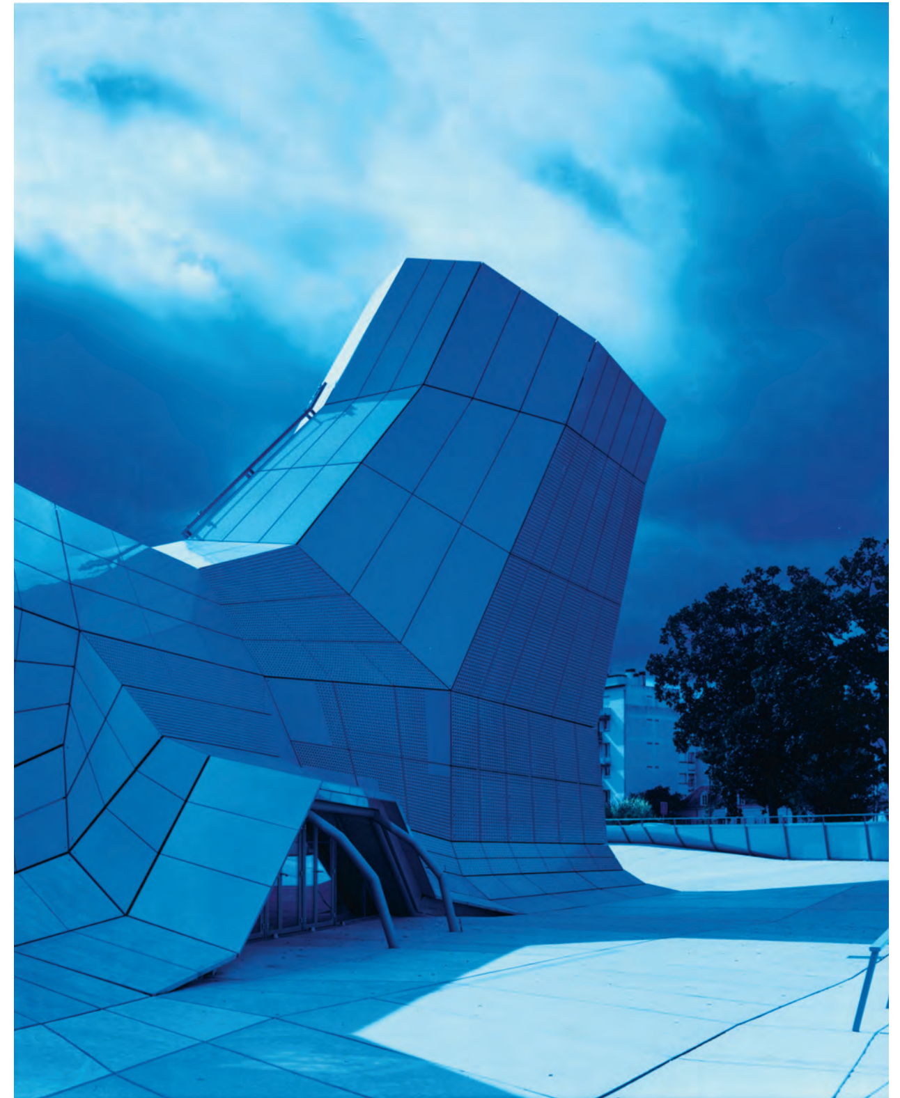
อนุสาวรีย์ที่ผสมผสานอลูมิเนียมและคอนกรีต ส่วนต่อเติมของ FRAC ภายใต้ชื่อ Les Turbulences นำเสนอสถาปัตยกรรมแห่งความเคลื่อนไหว.